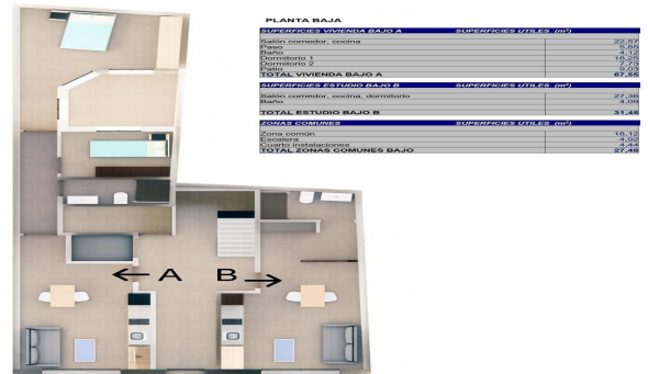
Planta Baja. Estudio B y Vivienda A