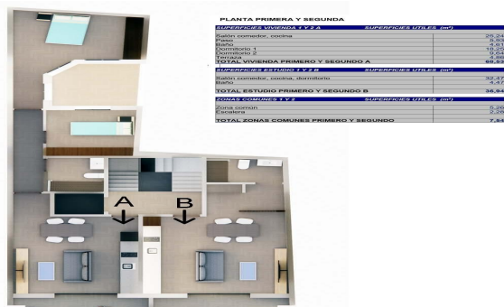
Planta Primera y segunda. Estudio B y Vivienda A